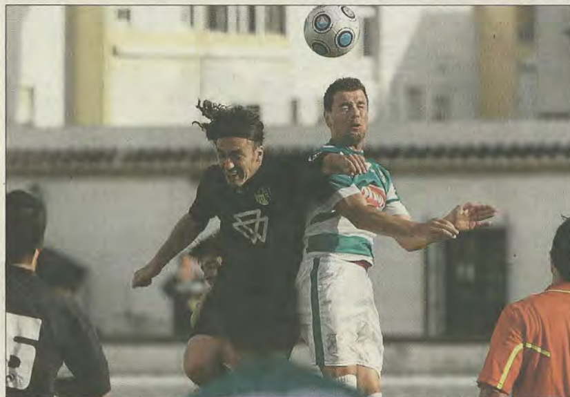
El Alcalá logró brillantemente el campeonato ganando al Puerto Real (1-3); en la imagen, el blanquiazul Platero.

El Alcalá se proclamó campeón de Liga en Puerto Real gracias a una merecida victoria por 1-3, ante un rival que ya no se jugaba nada, pero que no estaba dispuesto a facilitar la fiesta blanquiazul. El cuadro panadero mostró dos caras a lo largo de los noventa minutos, con una mala primera parte y una gran segunda mitad en la que certificó la victoria y el título. Por parte local, lo único que hizo en el primer acto fue un dispa-